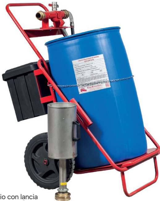
esempio con lancia media espansione

Nota: immagine a scopo illustrativo, il prodotto acquistato potrebbe differire dalla foto