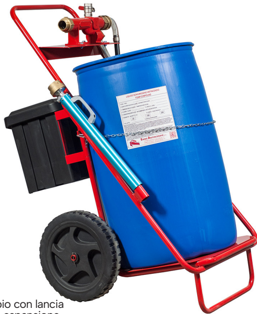
esempio con lancia bassa espansione

Componi il Gruppo Mobile in base alle tue esigenze indicando il tipo di telaio e di schiuma che trovi a pagina seguente.