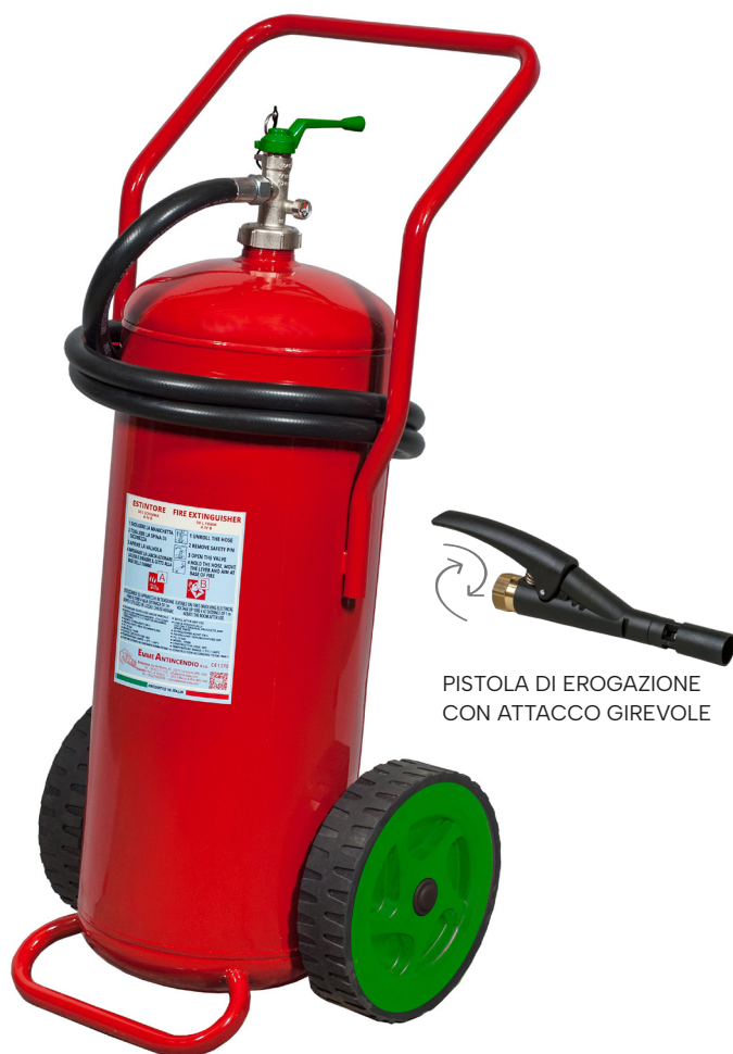
PISTOLA DI EROGAZIONE CON ATTACCO GIREVOLE